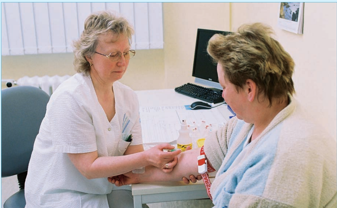
Untersuchung vor einem ambulanten Eingriff im Ambulanten Zentrum

Die Eröffnung des Ambulanten Zentrums ist für März 2007 geplant.