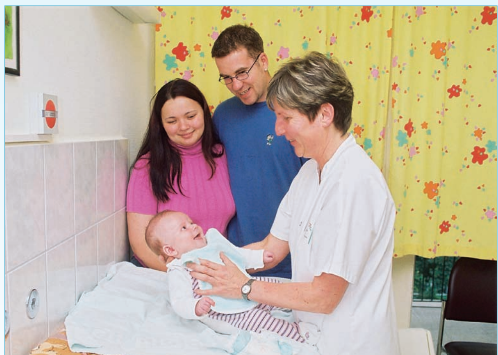
Anleitung bei der Pflege des erkrankten Säuglings für die Eltern durch die Krankenschwester

VK-Berechnung auf Basis der 40-Stunden-Woche