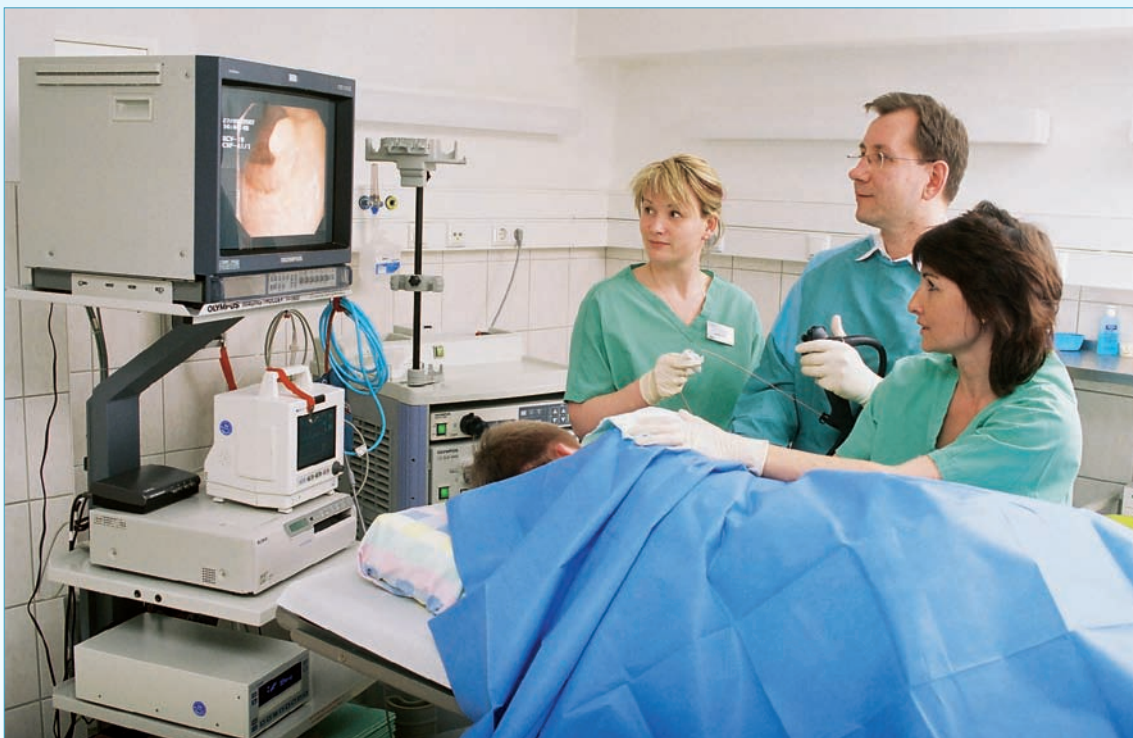
Gastroskopische Untersuchung bei einem Patienten